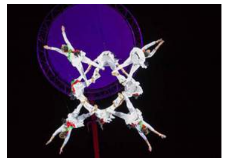
imágenes de los montajes para grandes eventos de Ponten Pie.