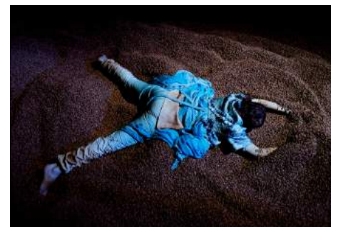
Imágenes de los espectáculos no convencionales de Ponten Pie.